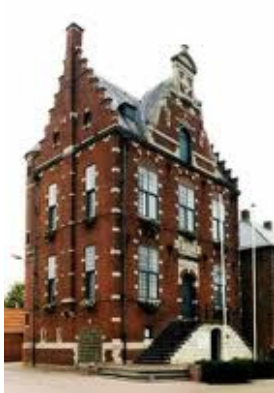
Gemeentehuis Hoogstraten Vrijheid 149 2320 Hoogstraten