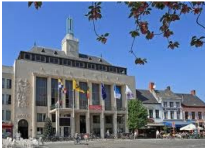
Gemeentehuis Turnhout Dorp 31 2360 Oud Turnhout

Mocht u na het lezen hiervan nog meer vragen of informatie willen hebben staan wij u graag te woord via onze vestiging in Breda.